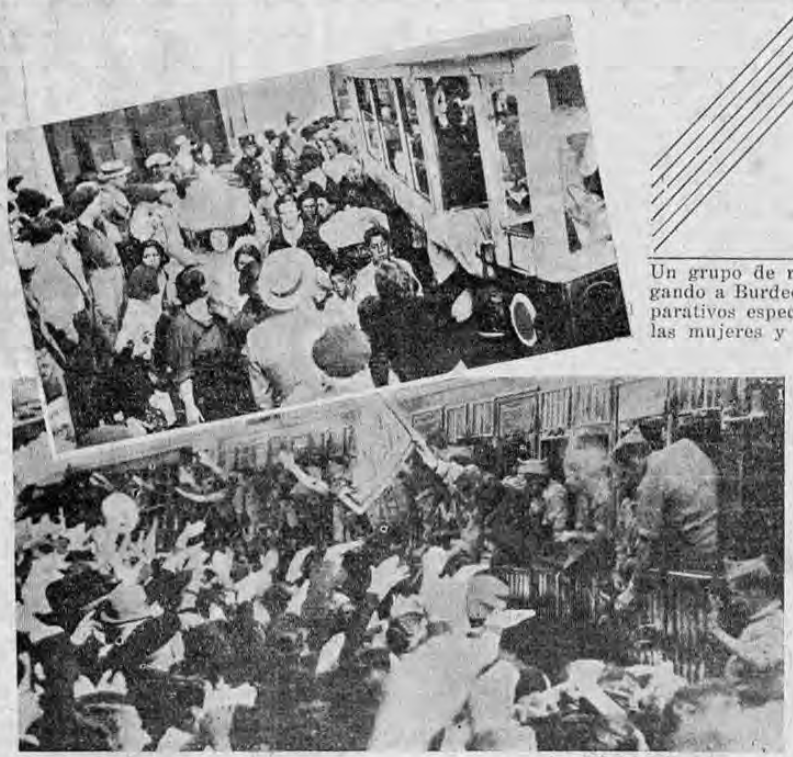
Un grupo de refugiados españoles está llegando a Burdeos. Los franceses hicieron preparativos especiales para cuidar de ellos, y las mujeres y niños fueron distribuidos en Tolosa, Angulema y otras ciudades hasta en la región de Poitiers. Mil milicianos atravesaron Francia en tren vía Perpignan rumbo a Barcelona.